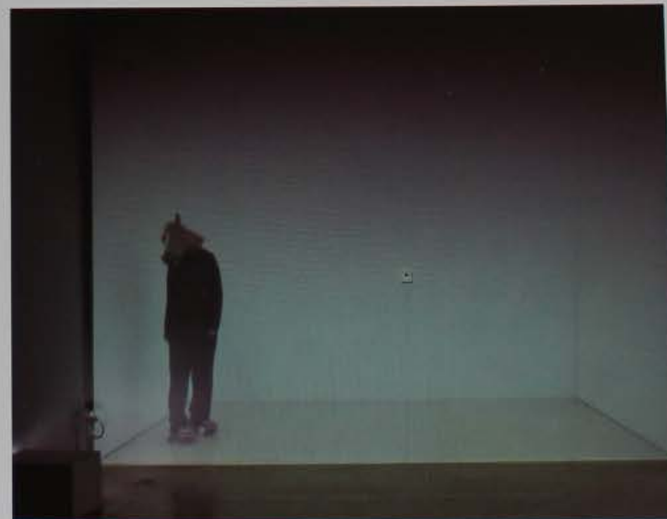
Cronopía, 2013 Instalación audiovisual interactiva