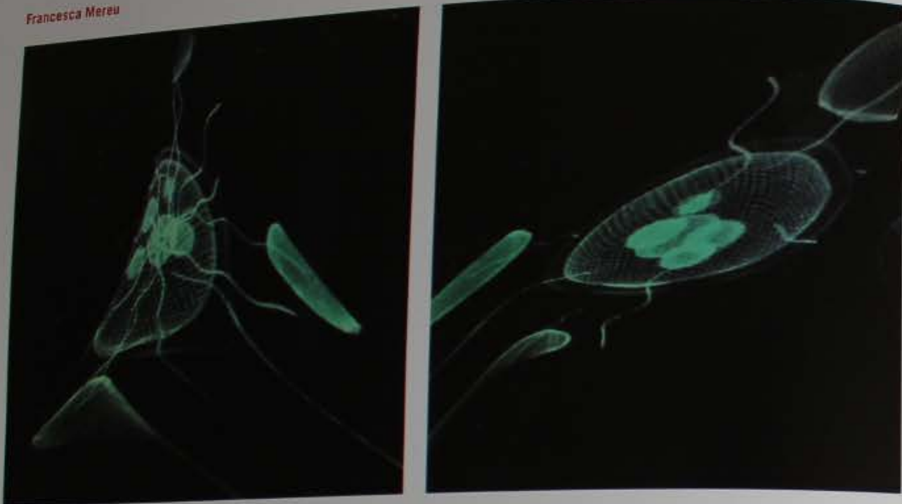
G011: Creación androide, 2011 Ambientación audiovisual 4'52"