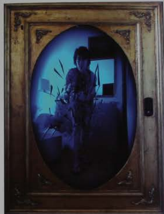
Frustration, 2012 Instalación interactiva