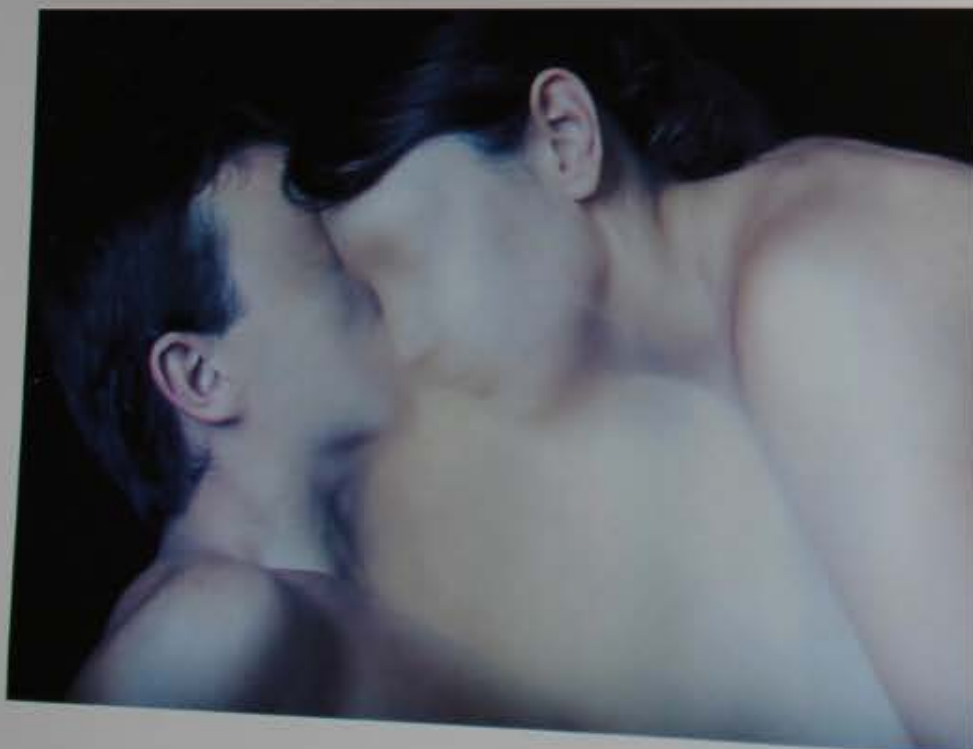
Vida y muerte de las estatuas, 2004 Fotografía con en caja de luz 70 x 90 cm