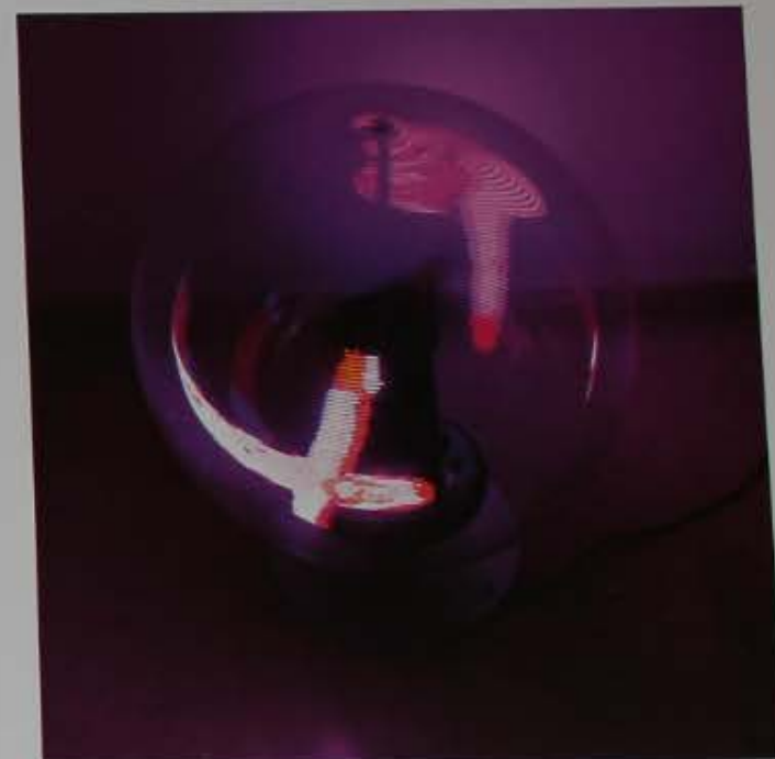
Floating Land, 2010 Escultura kinético-luminica